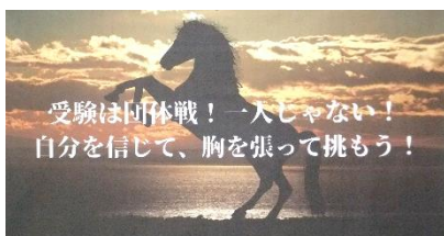
【3年団の先生方から】