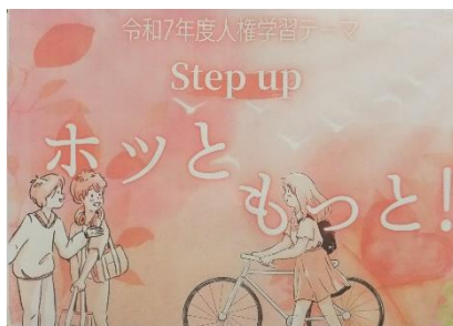
【人権学習のテーマ】

11月26日(水)の全校集会で生徒会本部役員から人権学習のテーマ『Step up ホツと もっと!』の発表がありました。『ホツと』することを増やすために「誰にとっても居心地がよい場所であり、仲間がいる学級、誰もが居心地のよい学級をつくりましょう。」と訴えました。生徒は、誰もが居心地のよい集団をつくるために、どんなことを心掛け、どんな言動をすればよいか、自分にできることは何かを考え、個人目標を決めて3週間の学習をスタートしました。