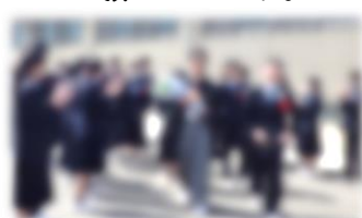
【1・2年生・保護者・来賓による見送り】