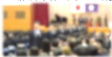
【フィナーレ 卒業生退場】