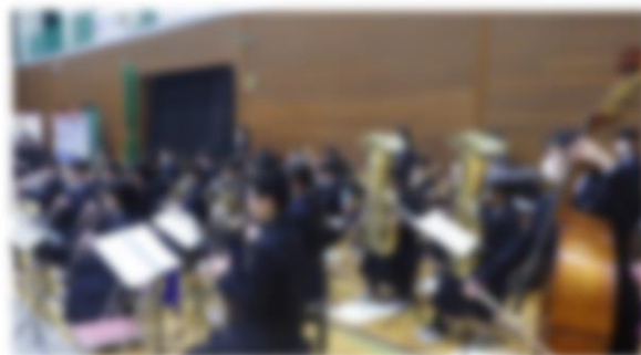
【吹奏楽部による生演奏】

3月14日(金)、春めいてきた温かな陽気の中、中学校における最大の行事の一つである卒業証書授与式を無事挙行することができました。お陰様で、多数のご来賓、保護者の方々のご列席のもと、盛大に卒業生を送り出すことができました。綾川中学校第3回目となる卒業式でしたが、凛とした緊迫感の中、随所に感動的な場面が見られる約1時間半余りの式典となりました。