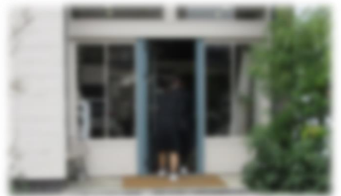
事前訪問する様子(キラリネイルにて)

また、11月26日(火)～28日(木)の3日間、職場体験学習を行いました。学校とは違う環境に戸惑いも見られましたが、次第に仕事を覚え、自ら進んで働く喜びややりがいを感じるようになってきたように思います。職場体験学習を終えての感想については、次の団通信にて紹介させていただきます。