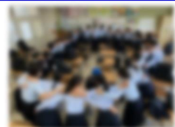
【出発前に円陣組んで!】