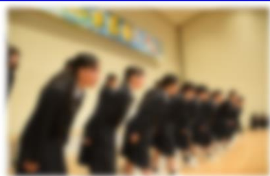
【声と動きで一体感を演出】